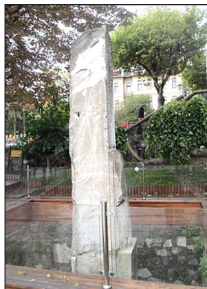
Κωνσταντινούπολις. Τὸ Μίλλιον.

Πολλὰ ἄρθρα της ἔχουν δημοσιευθεῖ σὲ διάφορες ἐφημερίδες καὶ περιοδικά.