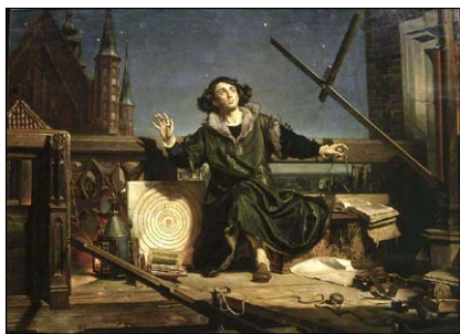
«Αστρονόμος Κοπέρνικος: Συνομιλία με τὸν Θεό».